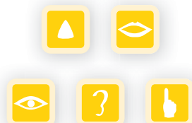
NLP – Sinneswahrnehmung und effiziente Kommunikation