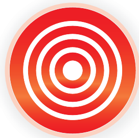
Persönliche Zielsetzung in Harmonie mit den eigenen Werten und Stärken